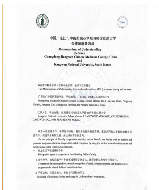
图 4 与韩国国立江原大学合作协议