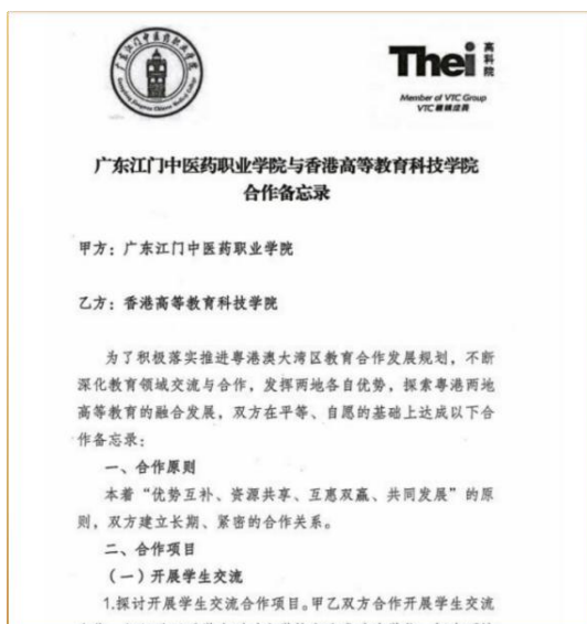
图5 学校与香港高等教育科技学院合作协议