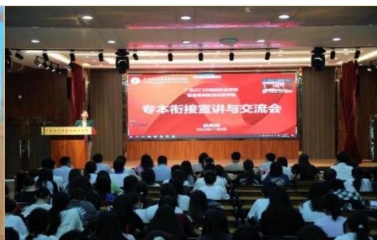
图8 开展香港高等教育科技学院现场宣讲