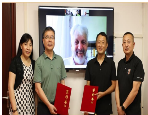
图1 与德国哥廷根护理职业学院代表签署协议

学校积极响应国家职教发展战略，推动学校办学国际化、开放化发展，服务“一带一路”战略，持续推进现代职业教育体系建设改革，2023年分别与德国哥廷根护理职业学院、韩国国立江原大学等国外高校达成专升本学历教育、科研合作、学术交流（高端论坛、学术会议等）、课程开发（网课、慕课）、联合实验室等方面的合作意向并签订合作协议，很好地满足了学校学子学历提升需求，畅通了专本衔接通道，形成高职本科衔接、职普贯通的培养体系。同时，为了培养具有国际竞争力的人才，为学生提供更广阔的国际视野平台，满足高职学生升读普通本科高校的基本条件，学校特别开设通识素养培训项目——汉语、德语、西班牙语等留学地语言培训，为同学们提供更加方便、多元的升学通道和就业路径。学校还与（斐济）南太平洋中医学院共设专业英语培训，为开展太平洋国家中医药推广，进一步推动中医药事业国外高质量发展奠定基础。