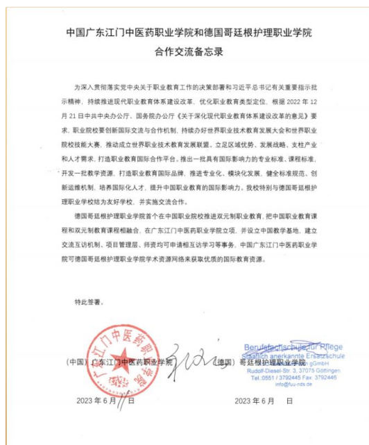
图 3 与德国哥廷根护理职业学院合作协议

互派、学生培养以及当地中草药资源普查等方面深度合作，推动斐济和南太岛国中医药事业高质量发展。