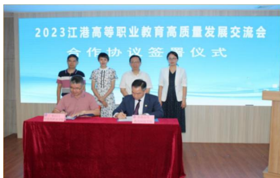
图7 与香港高校签署协议现场