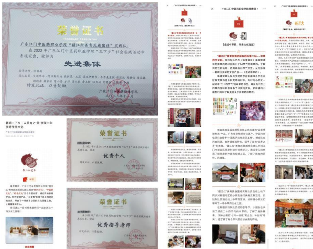
图 12：“疆江红美育民族团结实践队”暑期三下乡——以美育之“美”赓续中华优秀传统文化