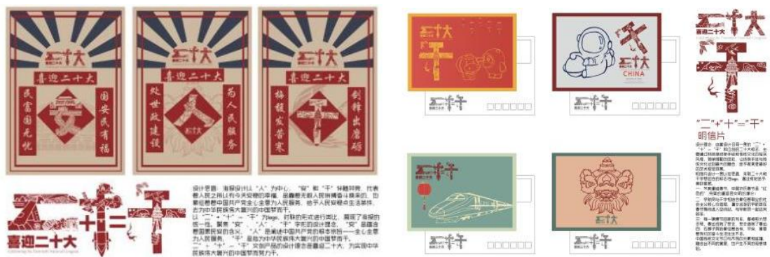
图8：“侨乡红色文化”海报、明信片设计