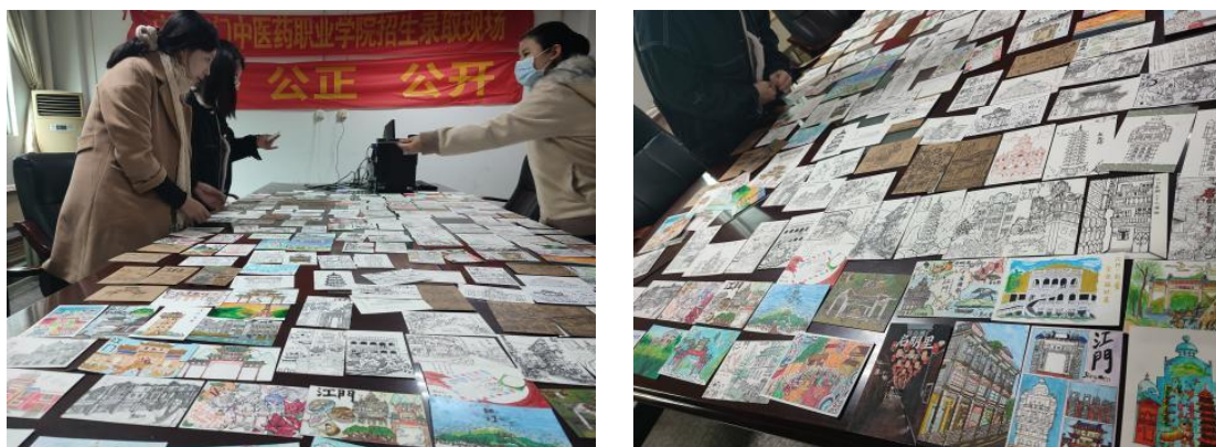
图 5：“侨乡”明信片设计大赛

药”中医药文创设计大赛（图6）、“侨乡文化”文创设计大赛（图7）、“侨乡红色文化”文创设计大赛（图8），“手拉手，一起舞”同心共舞，民族共融活动等，来内化吸收知识点，自主的进行查阅、绘制、感受江门“侨文化”。