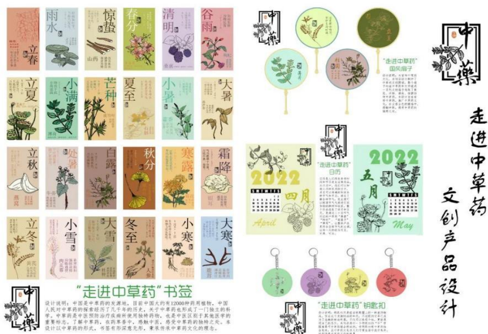
图 6：“走进中草药”中医药文创设计大赛