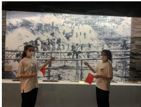
图 1:江门美术馆体验式课堂 图 2:五邑华侨博物馆体验式课