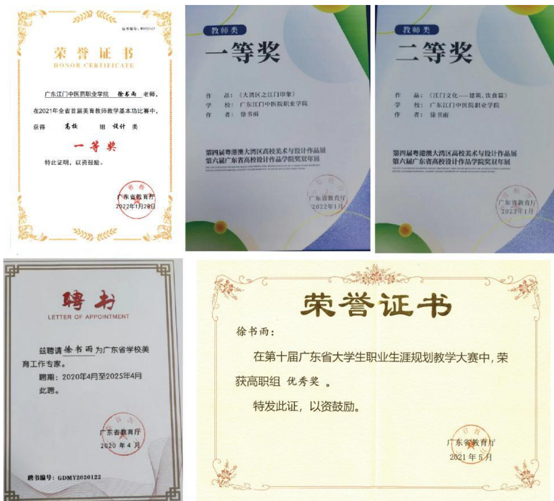
图片 13: 2020 年至今所获有关美育工作的成果