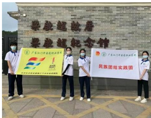
图 3:侨胞故居体验式课堂 图 4:三下乡体验式课堂