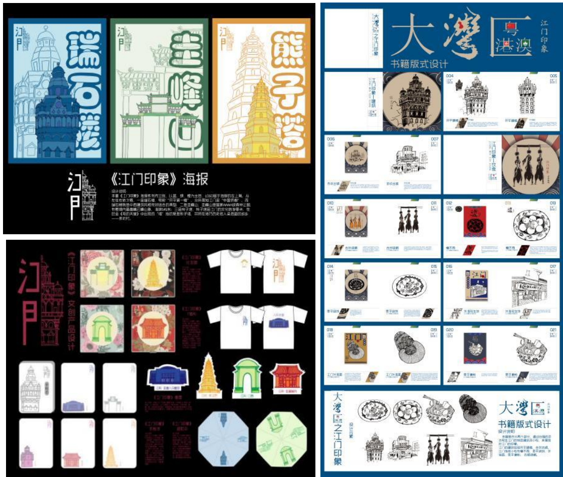
图7：“侨乡文化”书籍、海报、文创设计